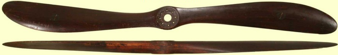
Hélice CHAUVIERE "INTEGRALE" (avions NIEUPOINT)