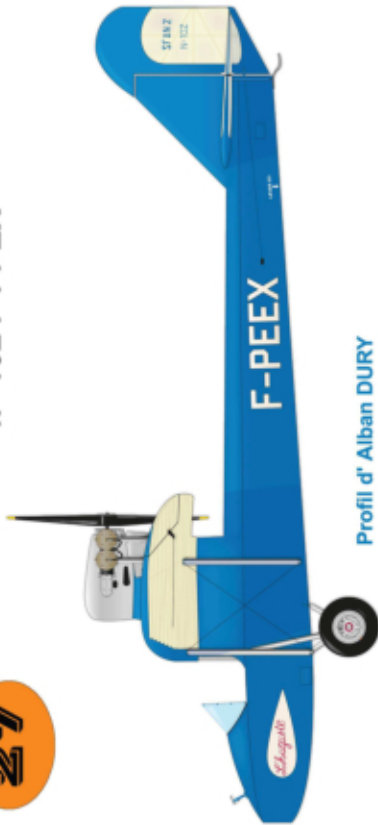
Profil d' Alban DURY